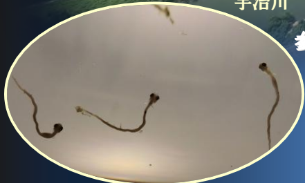
昨年の流下仔魚調査で採集したアユ H26.11.16(土)午後8時 木津川 御幸橋